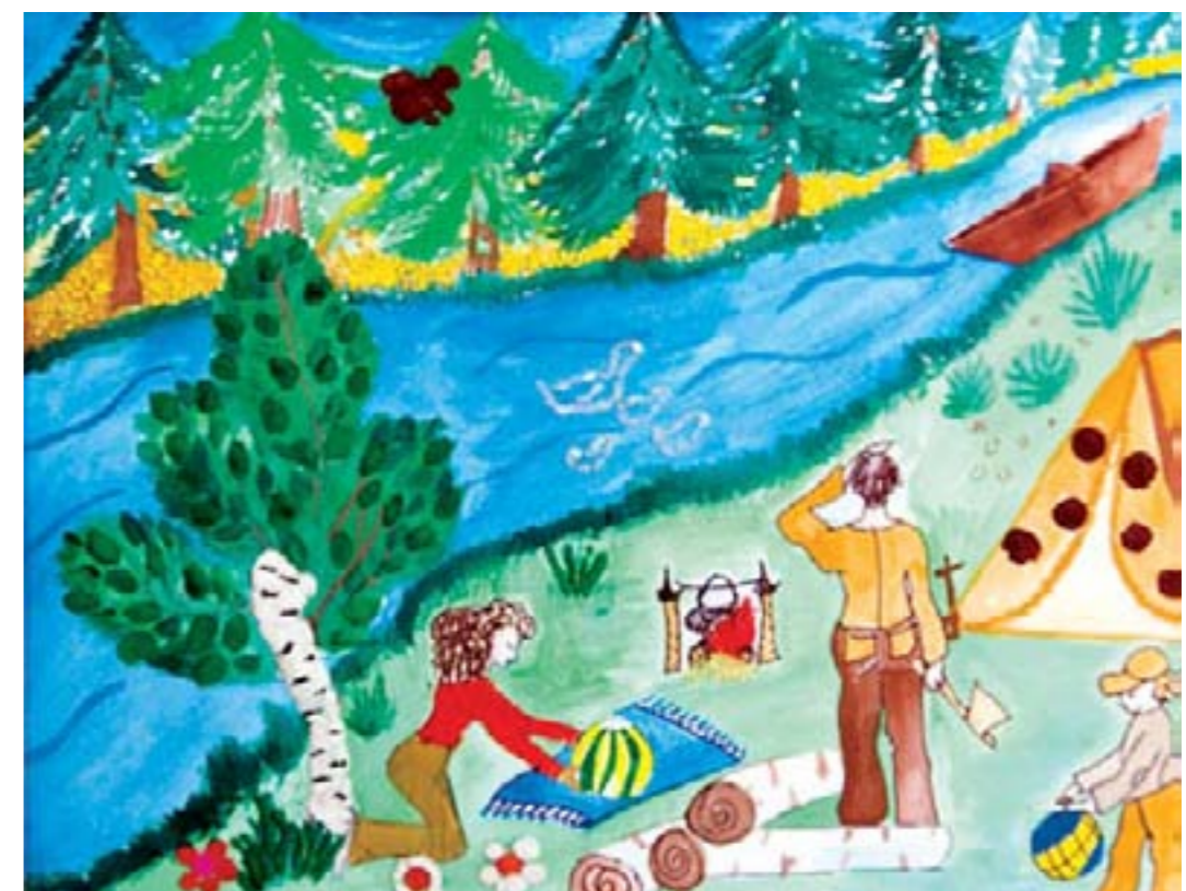
С семьей на отдыхе. Петранкин Миша