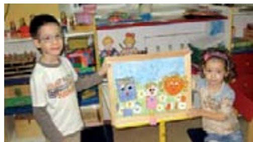
Группа «Зернышко» для детей с дцп

Это природная среда, культурные ландшафты, физкультурно-игровые и оздоровительные сооружения, детская библиотека, лекотека и видеотека, предметно-игровая и музыкально-театральная среда, а также предметно-развивающая среда занятий.