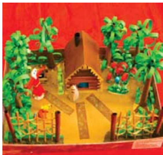
Мой дом. Коллективная работа