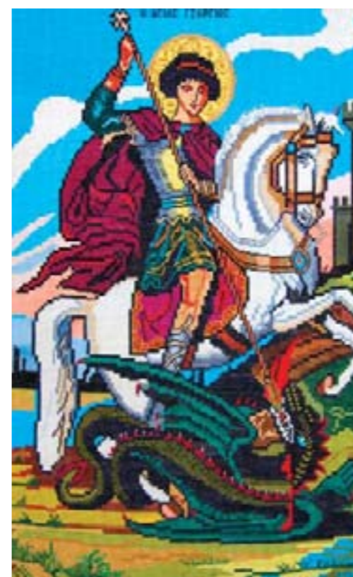
Георгий Победоносец. Кузьмичева А.