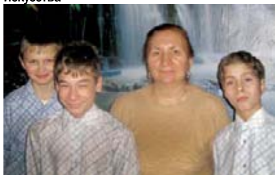
Кружок «Сделай сам»