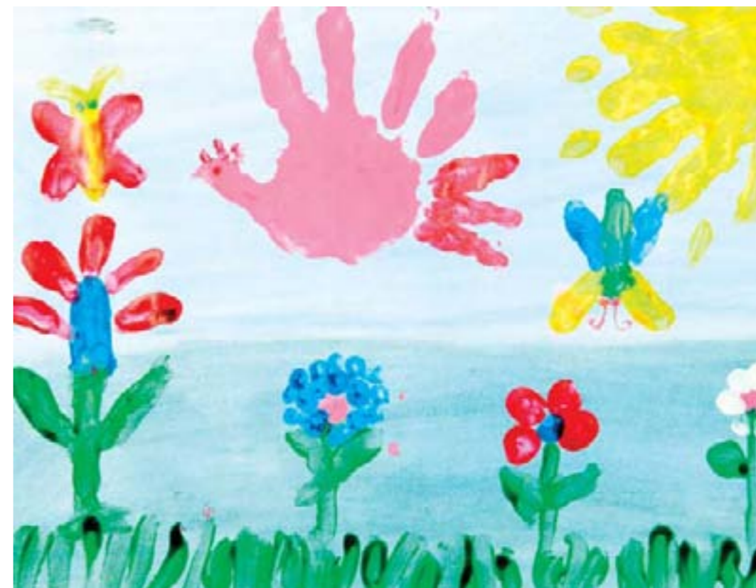
Летняя поляна. Феоктистов Рома