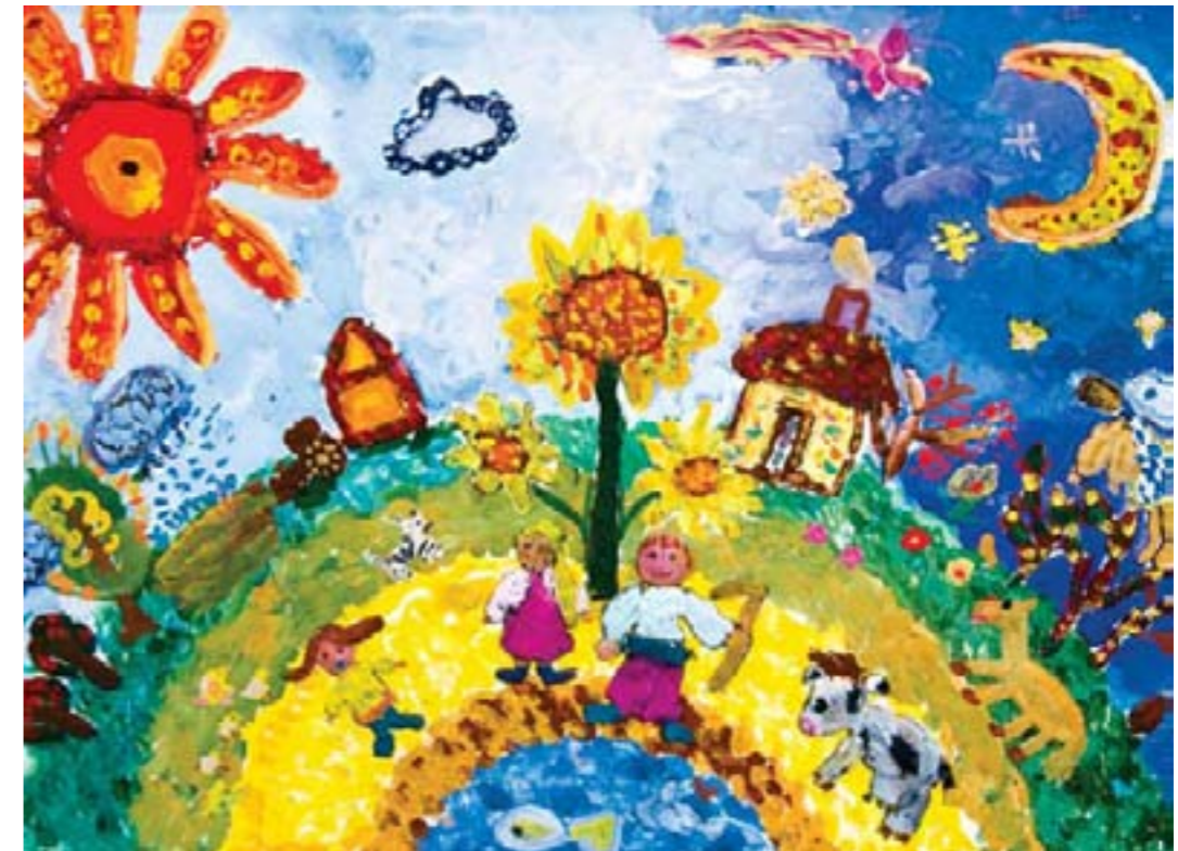
Ты только оглянись вокруг. Коллективная работа