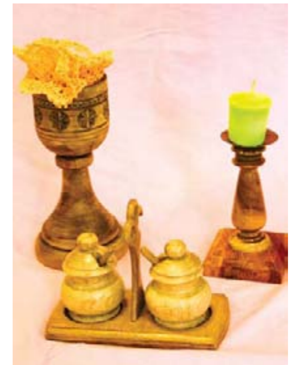
Набор для дома. Поленов Саша