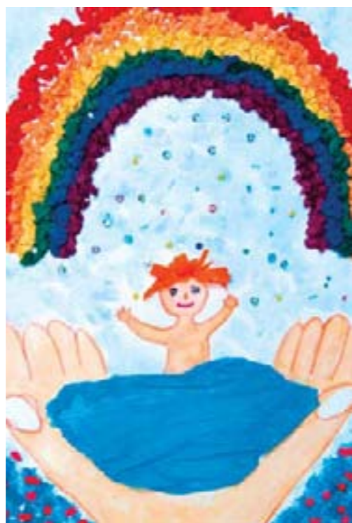
Радужное счастье. Коллективная работа