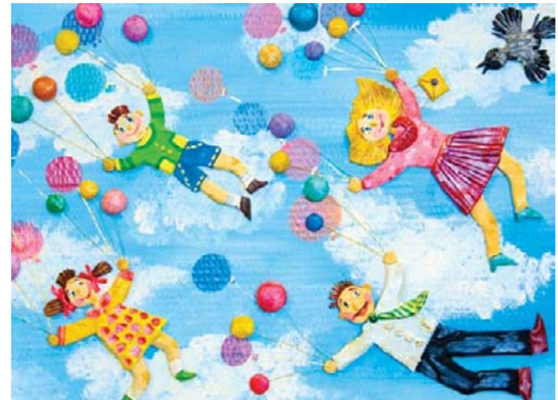
Прогулка в облаках. Коллективная работа