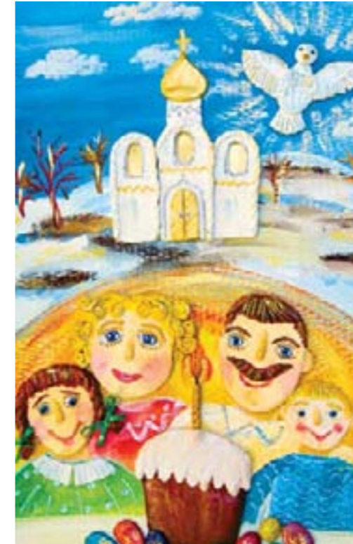
Благословенное счастье. Коллективная работа

Становление сложных форм изобразительности проходит в прямой взаимозависимости с развитием восприятия предметов и явлений действительности, понятия пространства и передачи его удаленности в рисунке, аппликационной работе, скульптурных композициях. Построение занятий основывается на психологопедагогических требованиях, учете ведущего вида деятельности и условиях познавательной активности. Изобразительная деятельность проходит в ситуации творческого поиска, дифференцированного подхода к каждому ребенку, в условиях активизации ассоциативных возможностей мышления. Итоговая часть деятельности – анализ детских работ – всегда направлена на формирование позиции создателя и чувства гордости за результат своего творчества.