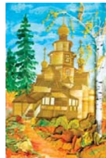
Храм. Орлов Коля