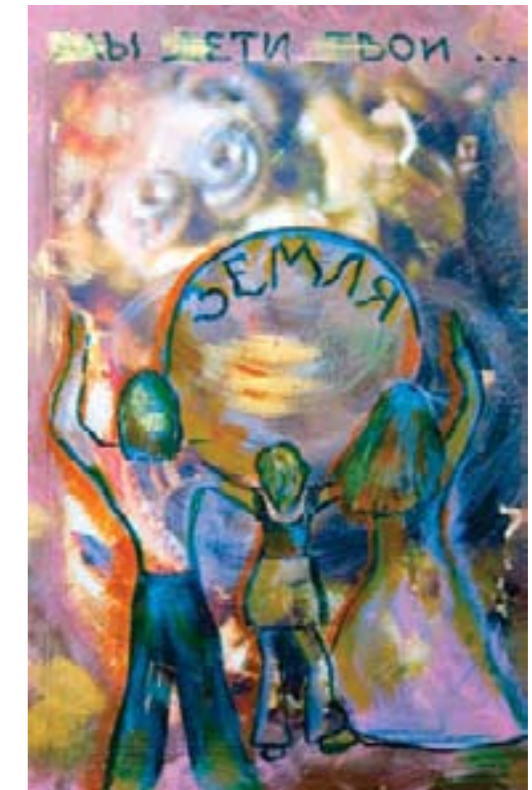
Мы дети твои, Земля. Бессмертнова Даша