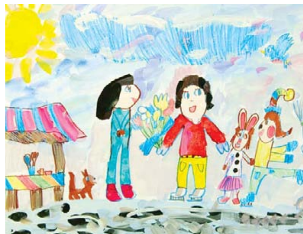
Моя семья на катке. Якунина Маша