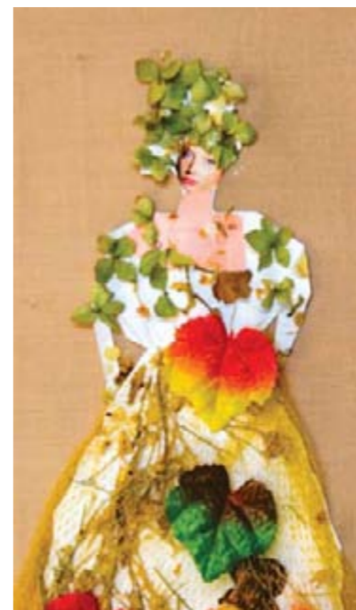
Времена года. Коллективная работа

На окружных Фестивалях детского художественного творчества «Надежда» представлены творческие коллективные работы воспитанников и педагогов в номинациях: фитодизайн; бумажная пластика; папье-маше; роспись по стеклу и зеркалу; аппликация из ткани; швейное изделие; изобразительное искусство: масло, акварель.