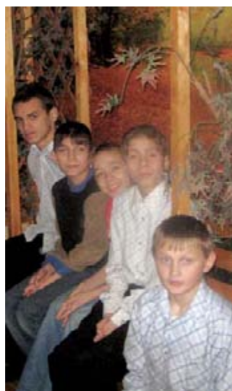
Кружок «Юный Художник»