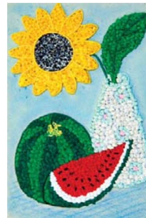
Подсолнух. Турбина Маша