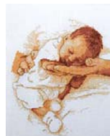
Спи моя радость. Коллективная работа