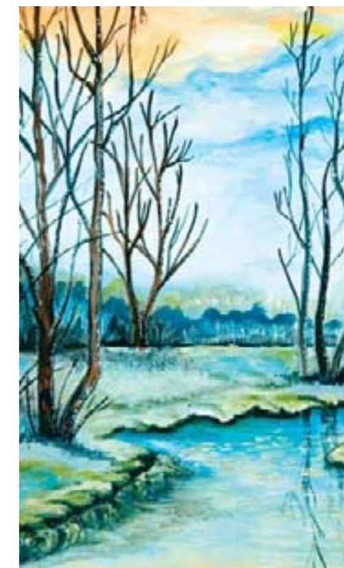
Ранние блики марта. Шкудов Юрий