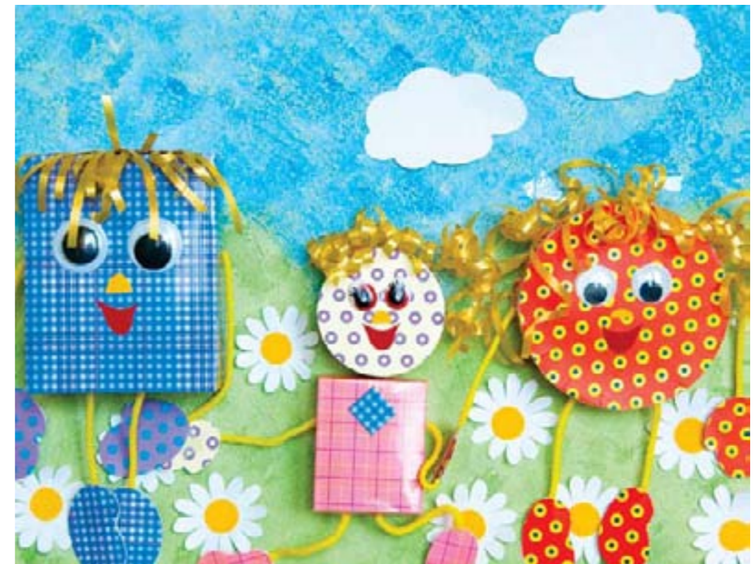
Я папин и мамин. Кервалишвили Давид