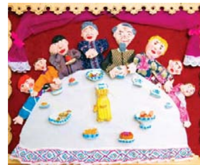
Большая семья. Коллективная работа