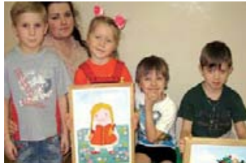
Группа (ОДА) «Кузнечики»

В нашем детском саду создана система условий, обеспечивающая всю полноту развития детской деятельности и его личности. Она включает ряд базисных компонентов, необходимых для полноценного физического, эстетического, познавательного и социального развития детей.