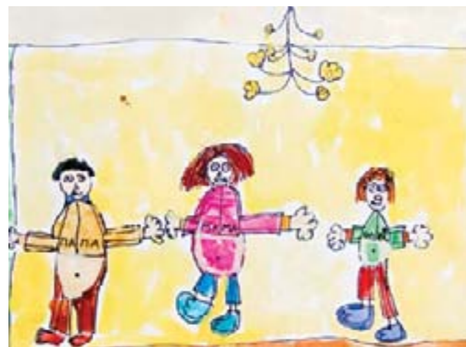
Мама, папа, я. Золотухина Олеся