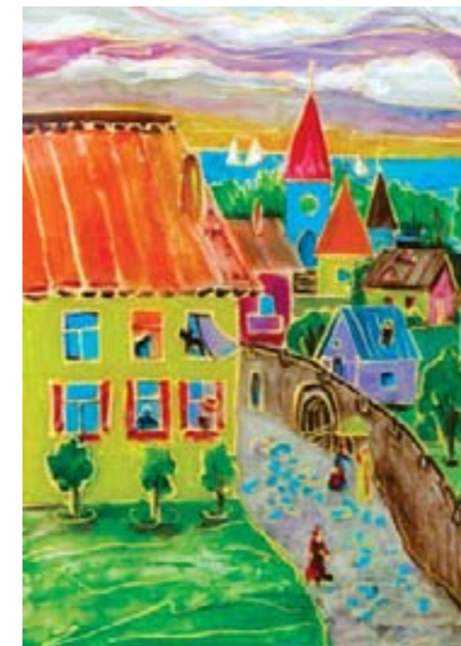
Городской пейзаж. Литвинина Кристина