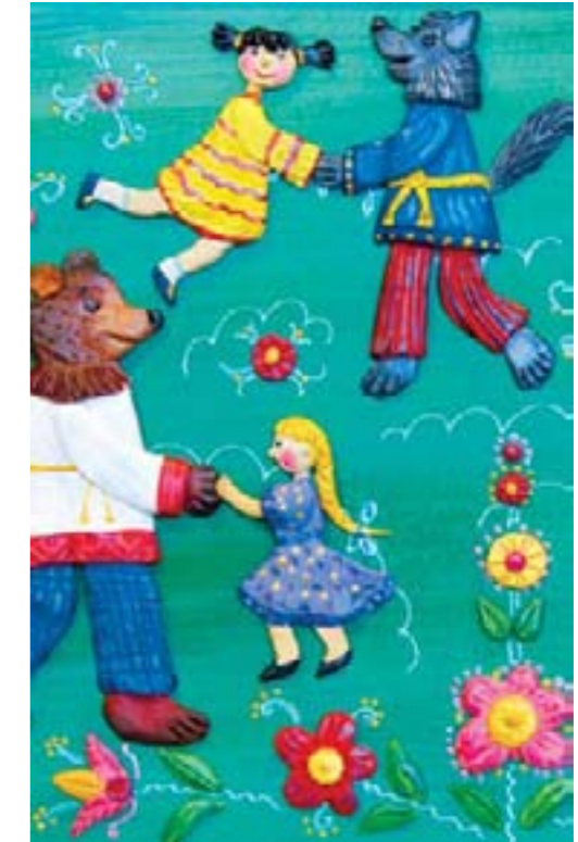
Бабушкины сказки. Коллективная работа