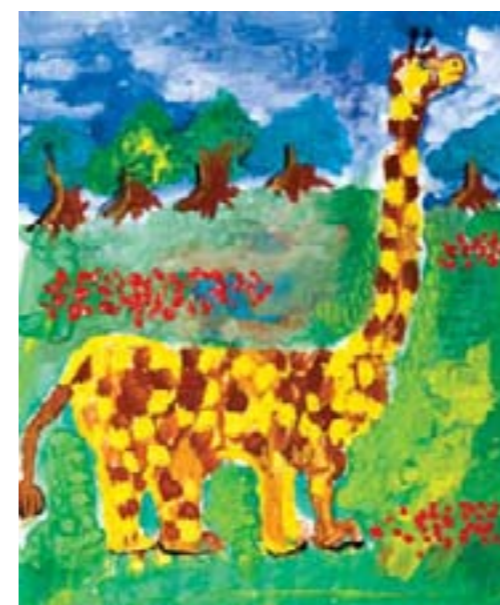
Весна в саванне. Дорофеев Гаврила