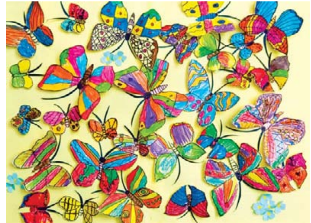
Веселая полянка. Коллективная работа