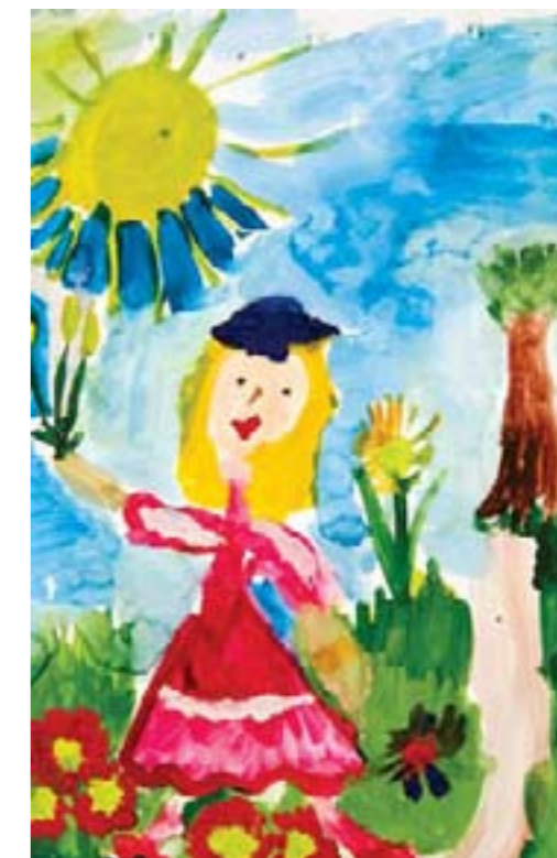
Пусть всегда будет Солнце. Даша Р.