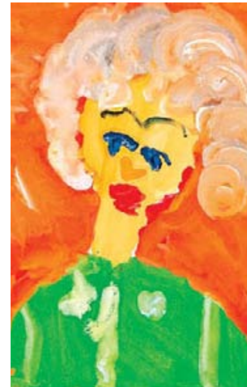
Портрет бабушки. Крайненков Егор