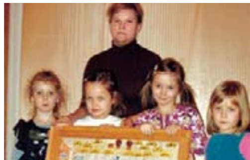
Группа «Дом Корчака»