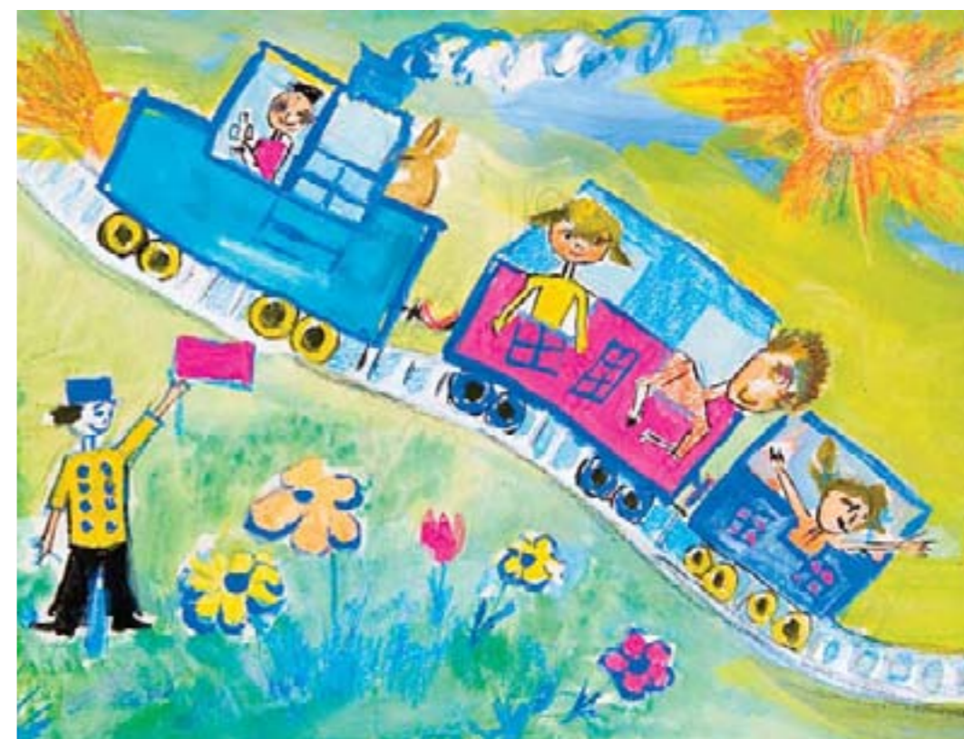
На природу всей семьей. Есютин Ваня