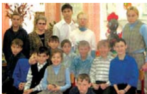
Студия декоративно-прикладного искусства