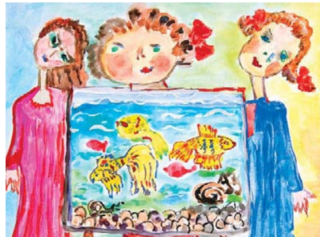
Домашний аквариум. Омельчук Таня

У изостудии большие планы на будущее. Мы постоянно осваиваем новые техники рисования и пополняем коллекцию живописных работ.