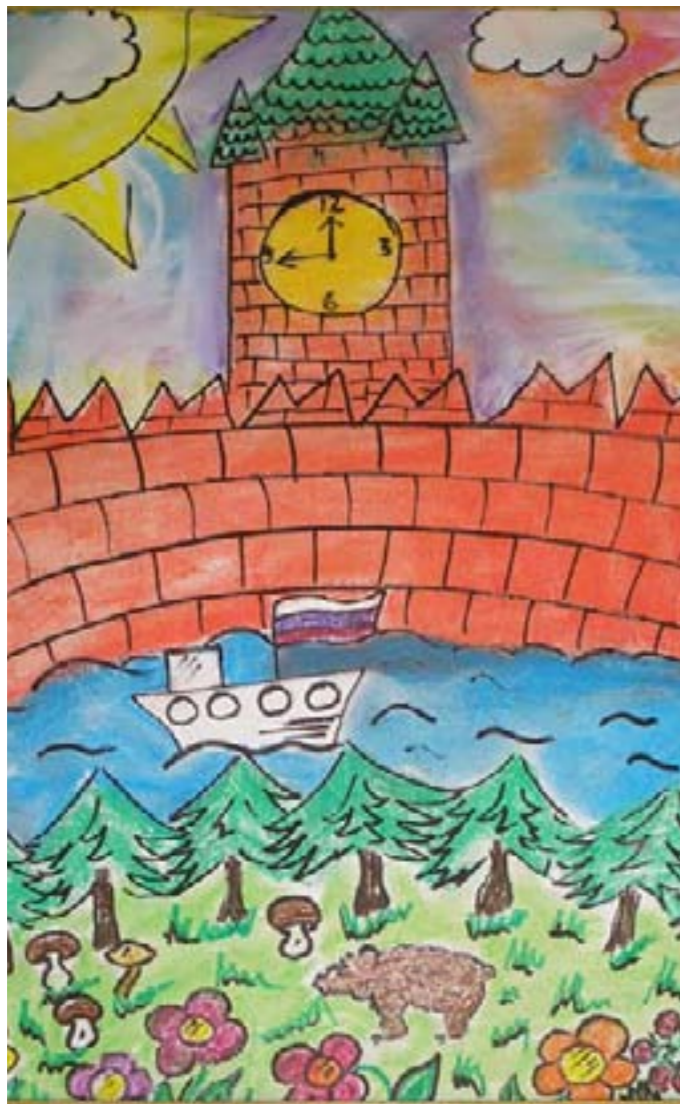
У стен старого Кремля