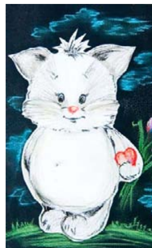
От сердца к сердцу. Киселева Люда