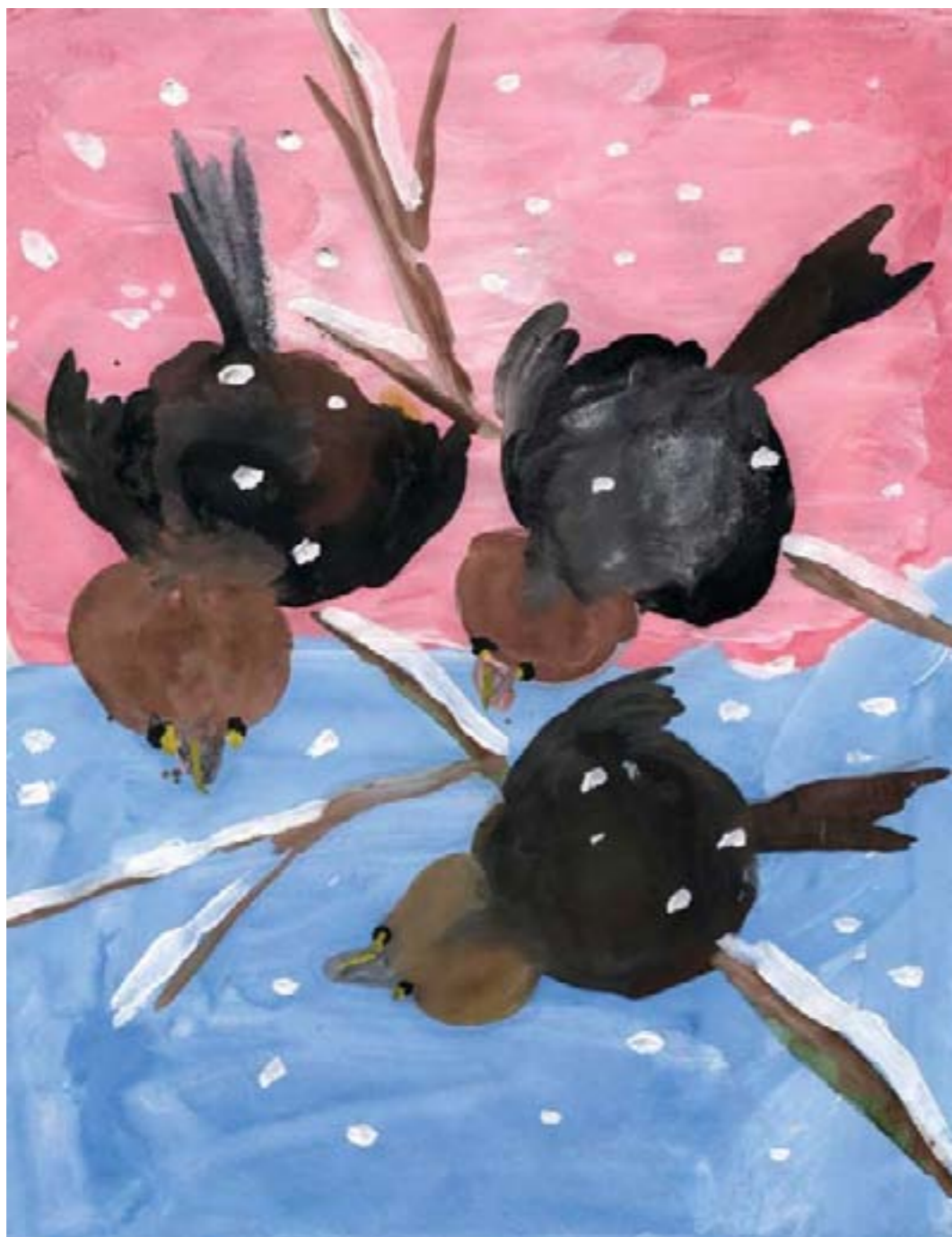
Воробы — зимующие птицы. Храмченок Дима