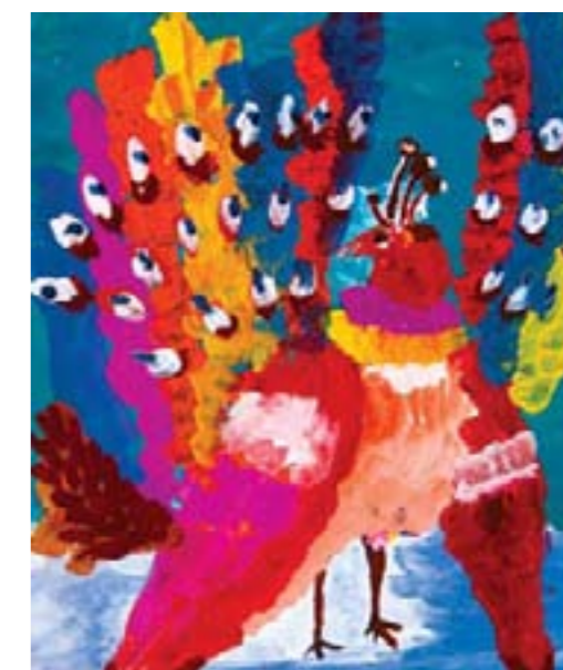
Птица павлин. Дорофеев Гаврила