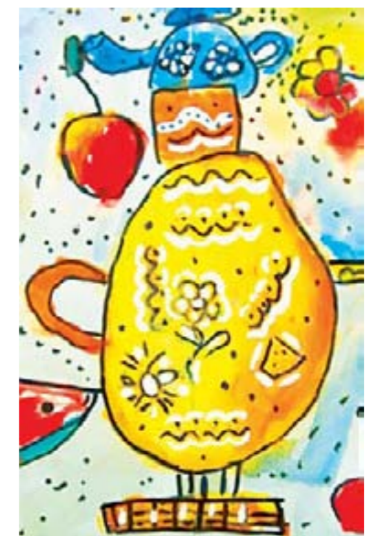
Праздничный стол. Рыбина Даша