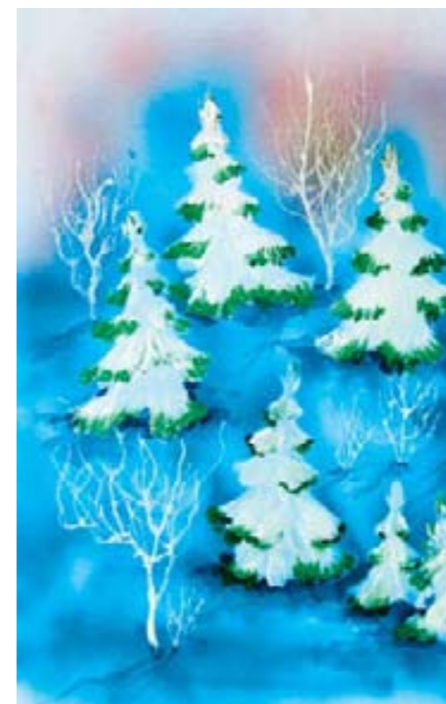
Родные просторы. Козин Максим