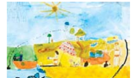
Пляжные развлечения. Виноградов Кирилл