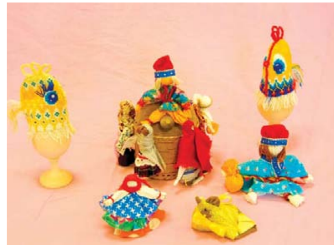
Куклы обереги. Дружная семейка. Коллективная работа