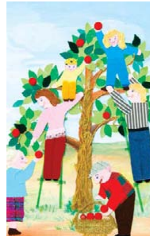
Семейное дерево. Коллективная работа

Это природная среда, культурные ландшафты, физкультурно-игровые и оздоровительные сооружения, детская библиотека, лекотека и видеотека, предметно-игровая и музыкально-театральная среда, а также предметно-развивающая среда занятий.